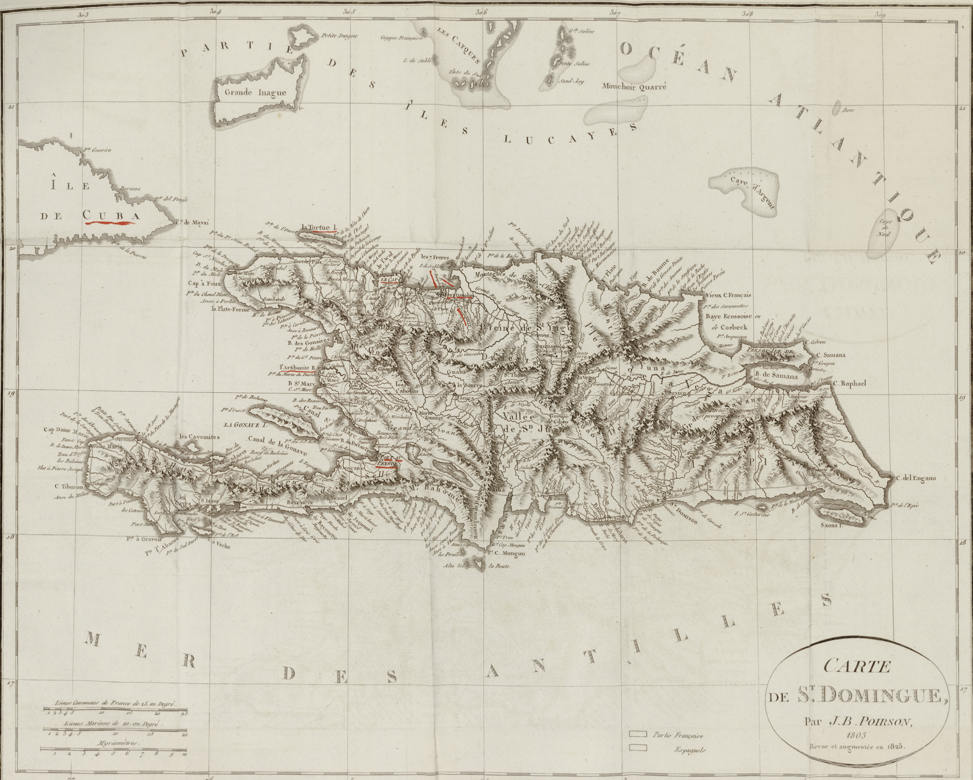
CARTE DE S. DOMINGUE, Par J.B. POIRSON, 1803 Revue et augmentée en 1825.