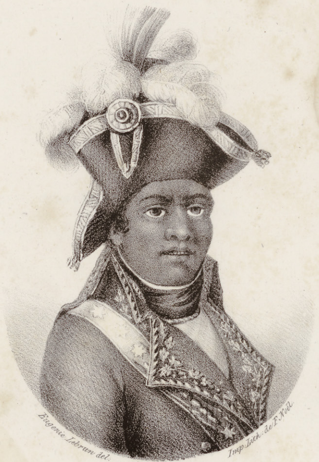
Toussaint Louverture. Général en Chef à S. t Domingue.