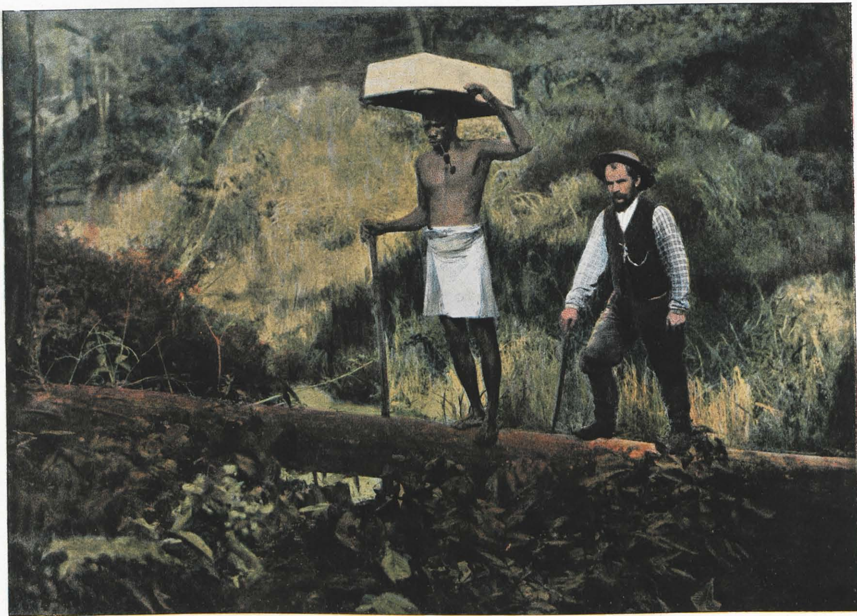
CCCLXV. — KENTZER (CHERCHEURS D'OR EN PROMENADE).