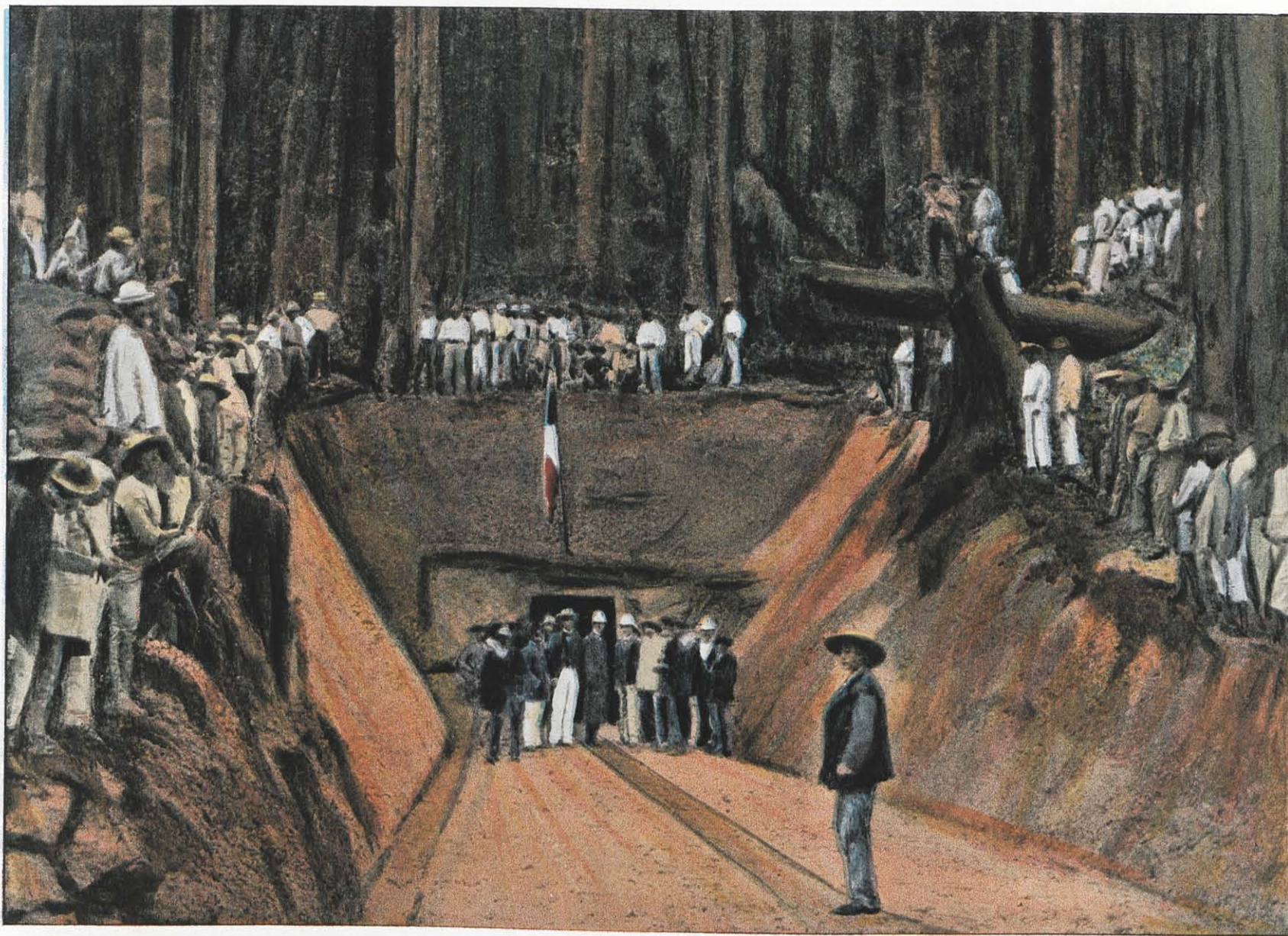
CCCLXIII. — SAINT-ÉLIE, INAUGURATION DE LA PREMIÈRE MINE DE QUARTZ.