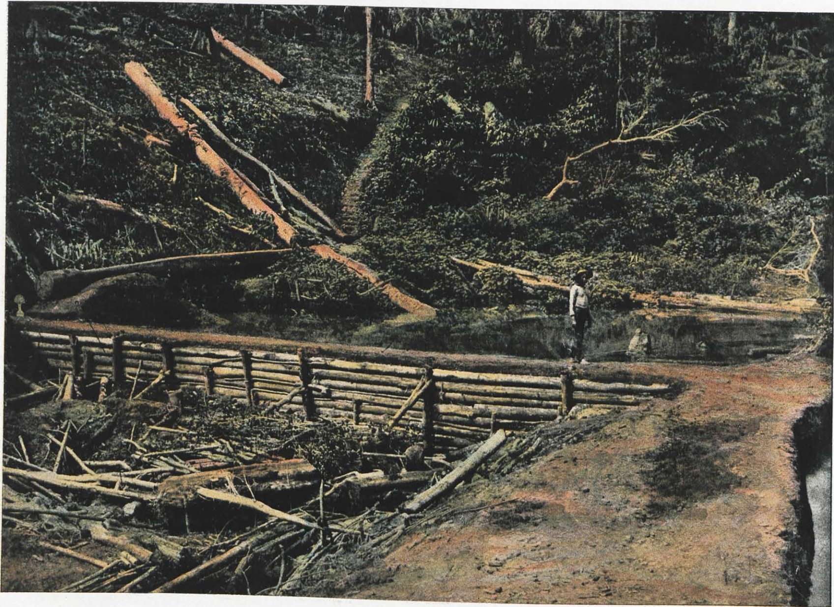
CCCLXVII. — SAINT-ELIE, LE GRAND BATARDEAU. (CONSTRUCTION.)