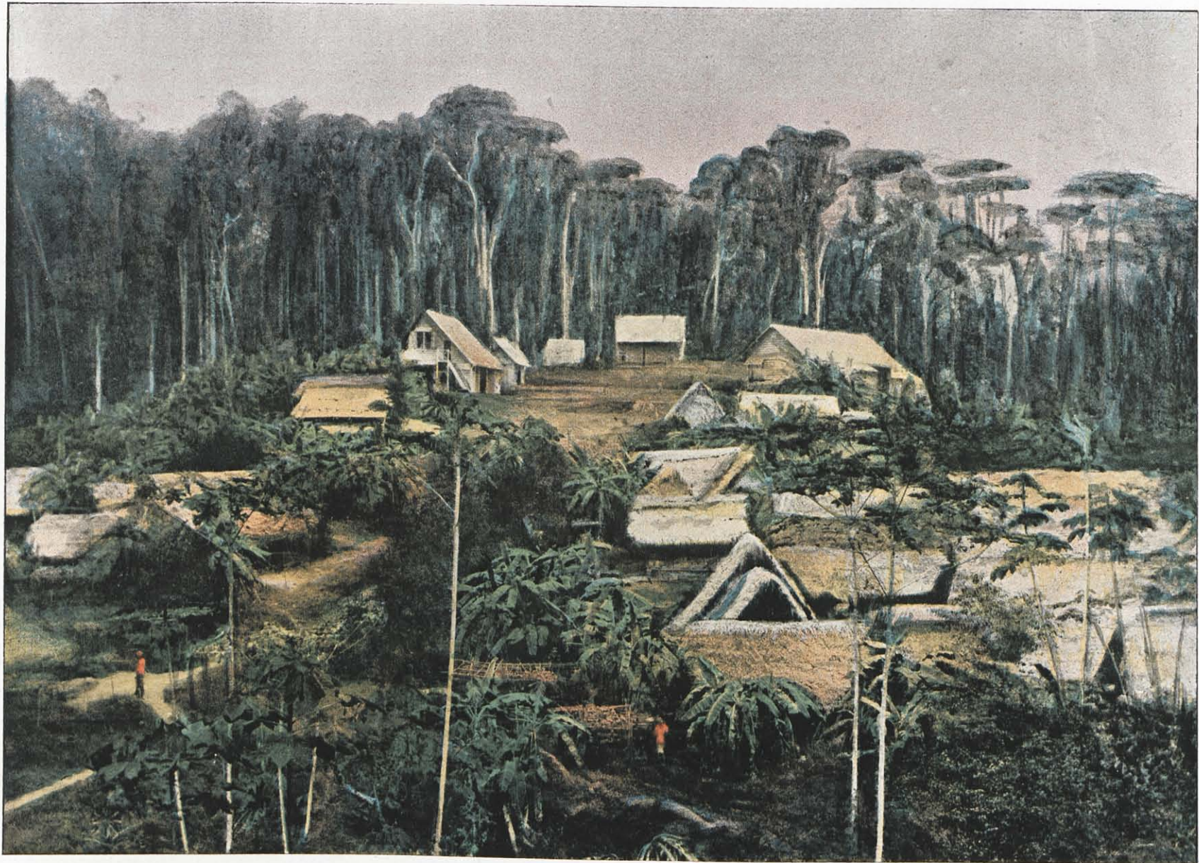
CCCLXII. — DIEU-MERCI, CANTONNEMENT DES CHERCHEURS D'OR.