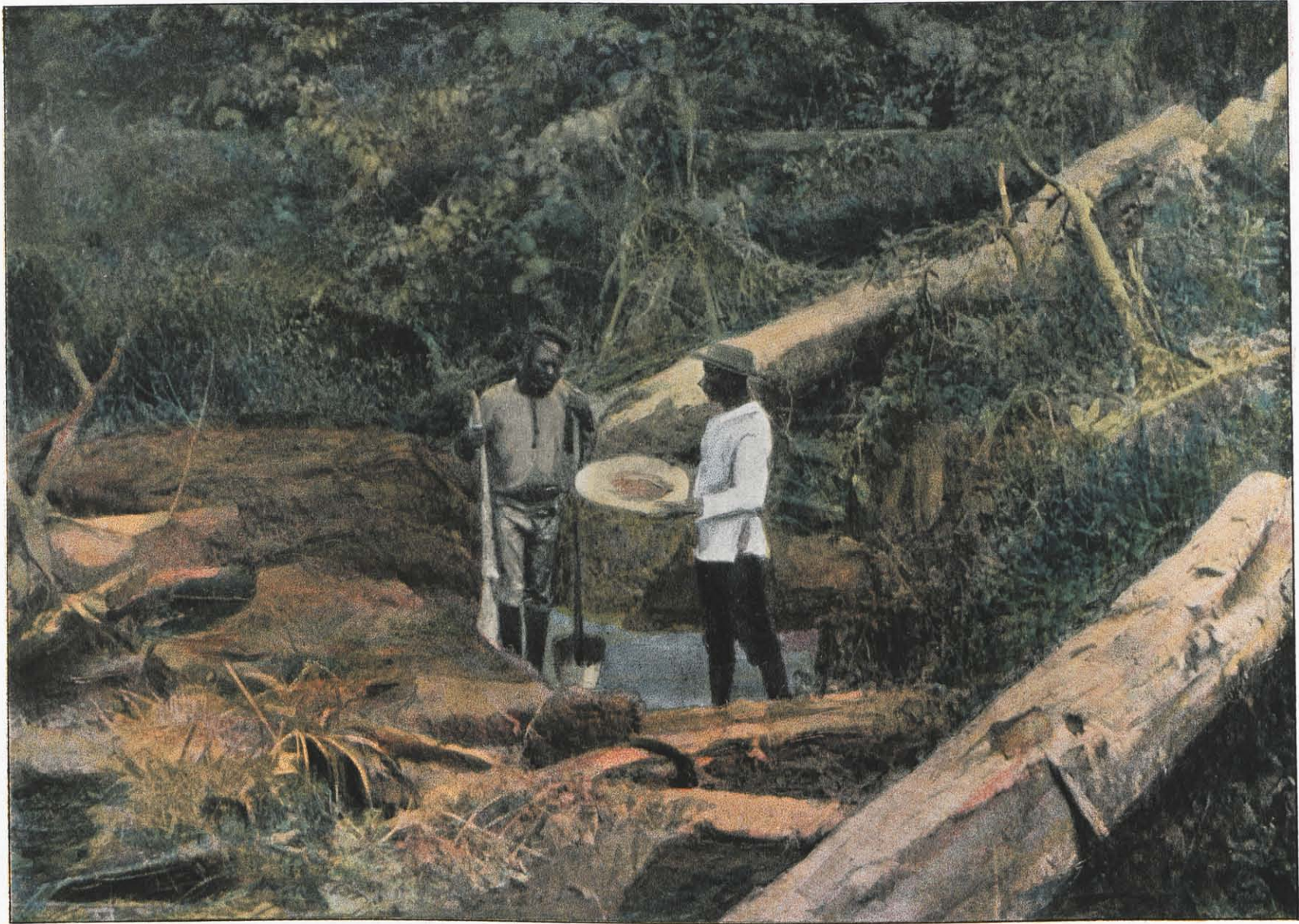
CCCLXVI. — SAINT-ELIÉ, LA BATTÉE (RECHERCHE DE L'OR).