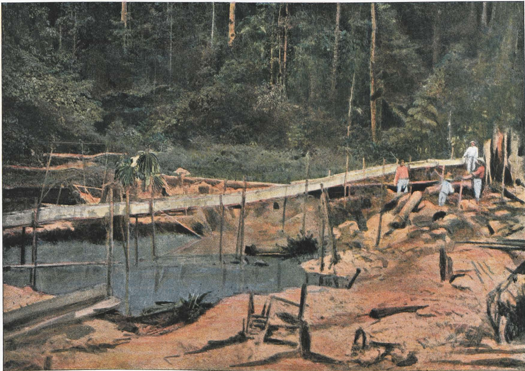
CCCLXVIII. — SAINT-ELIE, LE SCHLUSS (RIGOLE POUR L'OR).